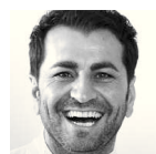
Ali Güngörmüs Sterne- und Starkoch