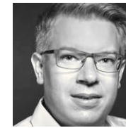
Frank Thelen Geschäftsführer Freigeist Capital