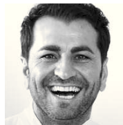
Ali Güngörmüs Sterne- und Starkoch